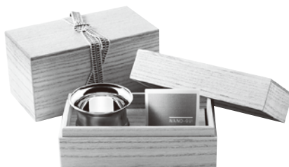
▲ NANO-GUI 1コ入

銀行名 東邦銀行 支店名 本店 口座番号 当座預金 口座番号 3422 口座名 (株)山川印刷所