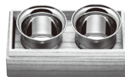
▲ NANO-GUI 2コ入

※通常は、桐箱を真田紐で結んでパッケージしておりますが、ラッピングに関してご希望がある方は、ご相談下さい。